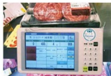
(写真1) 適合シールを貼付したばかり